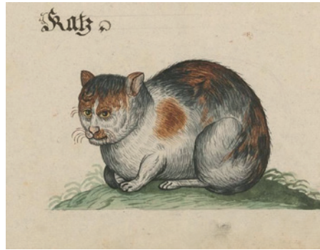
Le chat à travers l'histoire _ quelques exemples : égyptien, mosaïque (Pompéi), Moyen-Âge