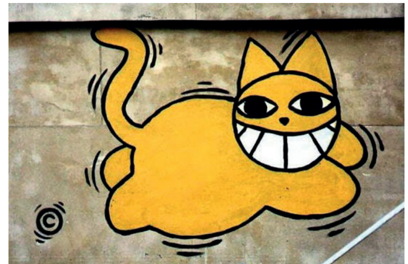
M.Chat de Thoma Vuille (Street art)