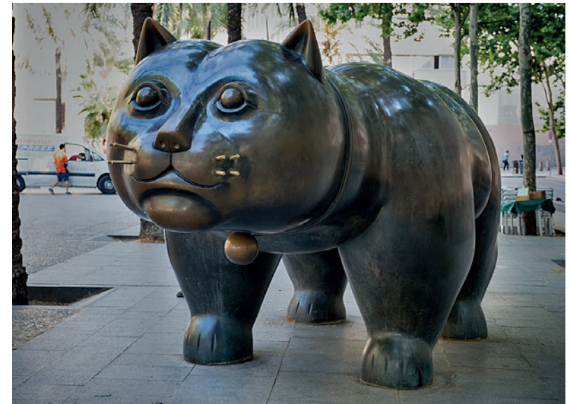
Le gros chat _ de Fernando Botero (Barcelone)